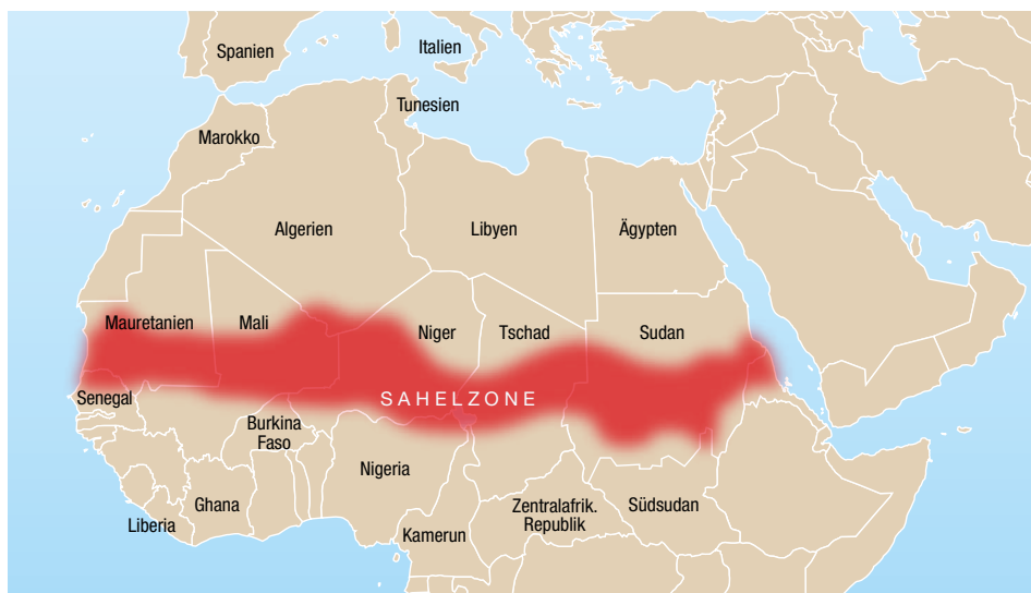
Sahelzone: Afrikas trockener Gürtel

auf Nahrungsmittelhilfe angewiesen, während gleichzeitig im Westsahel 600 000 Menschen Opfer von Überschwemmungen wurden. 2012 waren weit mehr als 10 Millionen Menschen im westlichen Sahel von einer Hungersnot betroffen. Im Juni 2013 verwies die EU darauf, dass es «in der gesamten Sahelzone zu einer schweren Ernährungskrise kommen wird» und über vier Millionen Kinder von akuter Unterernährung bedroht seien. Ohne schnelle Anpassungsleistungen wird sich die Wüste in schnellen Schritten weiter ausbreiten, wird sich gesellschaftliches Leben in weiten Teilen des Sahel grundlegend verändern.